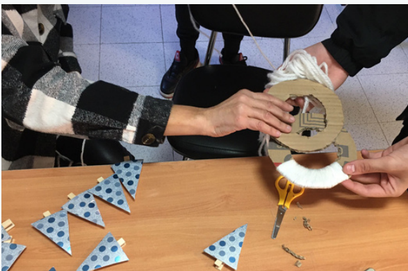
PROYECTOS DE ESCAPARATISMO