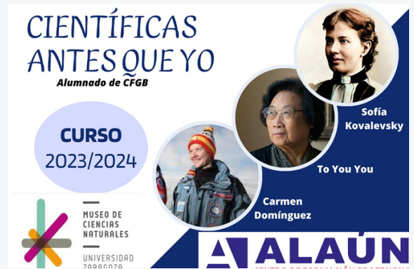
'MUJERES CIENTIFICAS ANTES QUE YO'