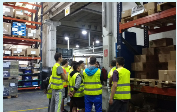
VISITAS A CENTROS LOGÍSTICOS Y COMERCIALES