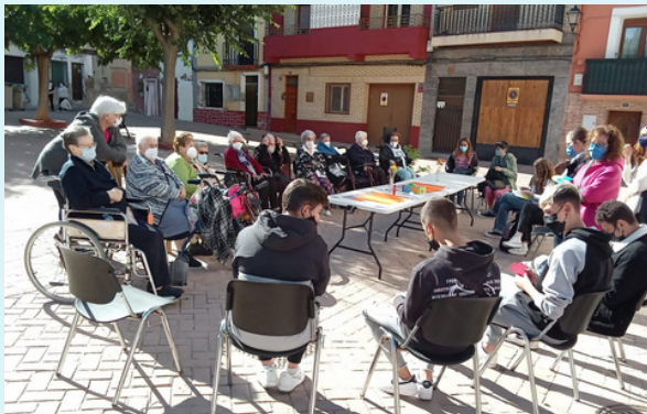
PROYECTO APRENDIZAJE Y SERVICIO